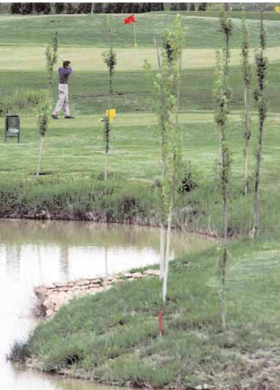
JULIO E. FOSTER

En los últimos años se ha producido una gran variación en el tipo de practicantes del golf. Ha llegado un público más joven, lo que conlleva la creación de cursos de iniciación y escuela