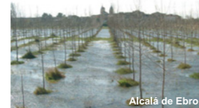
Alcalá de Ebro

Oficina de turismo de Ejea Pza. La Magdalena s/n 50600 Ejea de los Caballeros Telf. 976 67 74 74 sofejea@aytoejea.es www.ejea.net