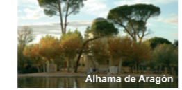
Alhama de Aragón

Monasterio de Piedra Telf. 902 19 60 52 promocion@monasteriopiedra.com www.monasteriopiedra.com