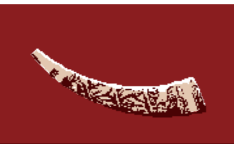
Olifante de Gastón de Béarn

TRANSPYRENALIA CONGRESOS INTERNACIONALES SOBRE LA CONGRÈS INTERNATIONAUX SUR LA CIVILIZACIÓN MEDIEVAL EN ARAGON Y BÉARN CIVILISATION MEDIEVALE EN ARAGON ET EN BÉARN