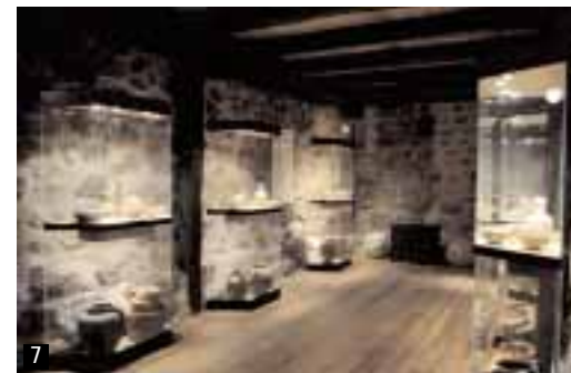
JULIO E. FOSTER. ARCHIVO PRAMES