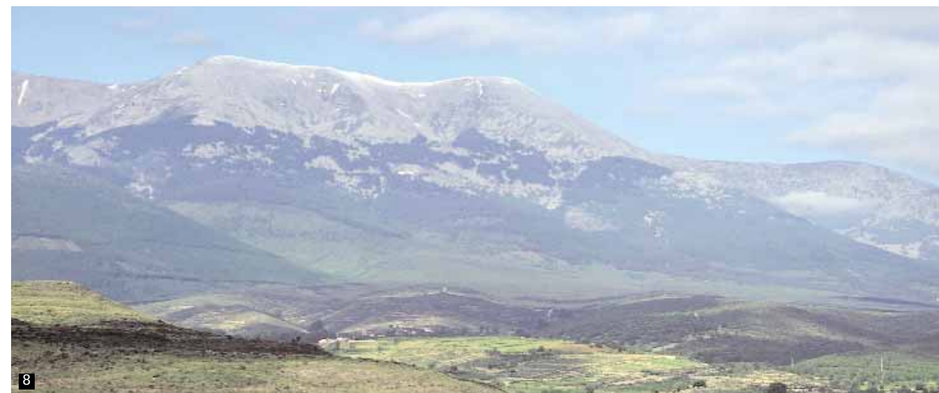
JULIO E. FOSTER. ARCHIVO PRAMES