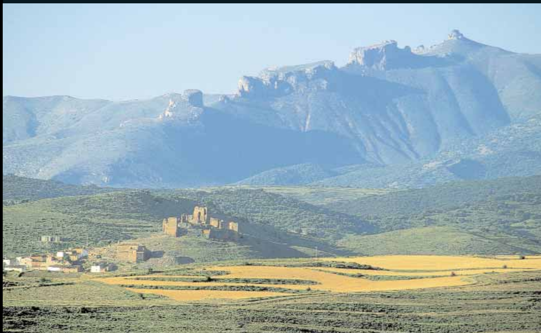
JULIO E. FOSTER. ARCHIVO PRAMES