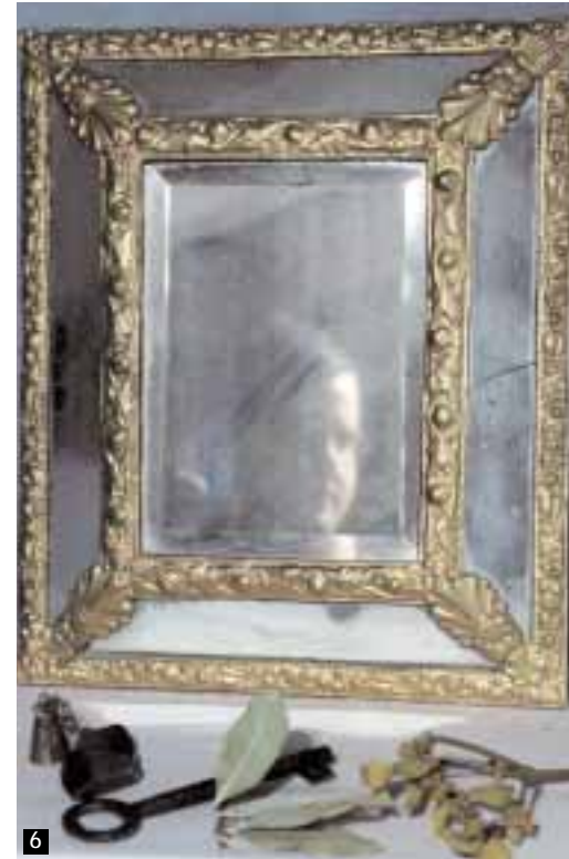
JULIO E. FOSTER. ARCHIVO PRAMES

El castillo de Trasmoz fue abandonado a principios del siglo XVI y cayó en desuso. En los siglos siguientes se convirtió en campo de escombros y en cantera para extraer materiales para nuevas construcciones en el pueblo, aunque sus ruinas quedaron como mudo testigo de una época en la que fue el verdadero protagonista de un buen pedazo de la historia de la Edad Media aragonesa. Aquí, para el viajero que quiera sentirla, sigue latiendo la emoción de aquellos tiempos legendarios en los que fue morada de damas y caballeros. ■