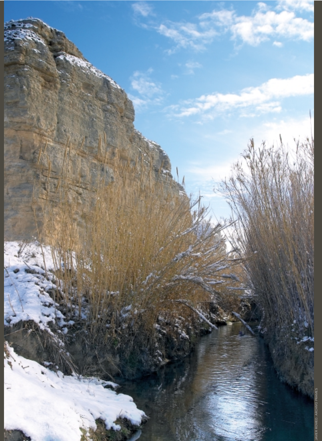
JAVIER ROMEO. ARCHIVO PRAMES