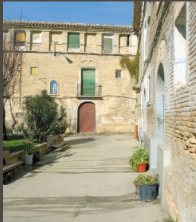
JULIO E. FOSTER. ARCHIVO PRAMES