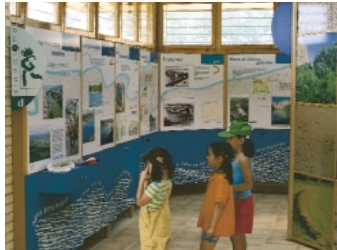
Centro de visitantes e interpretación