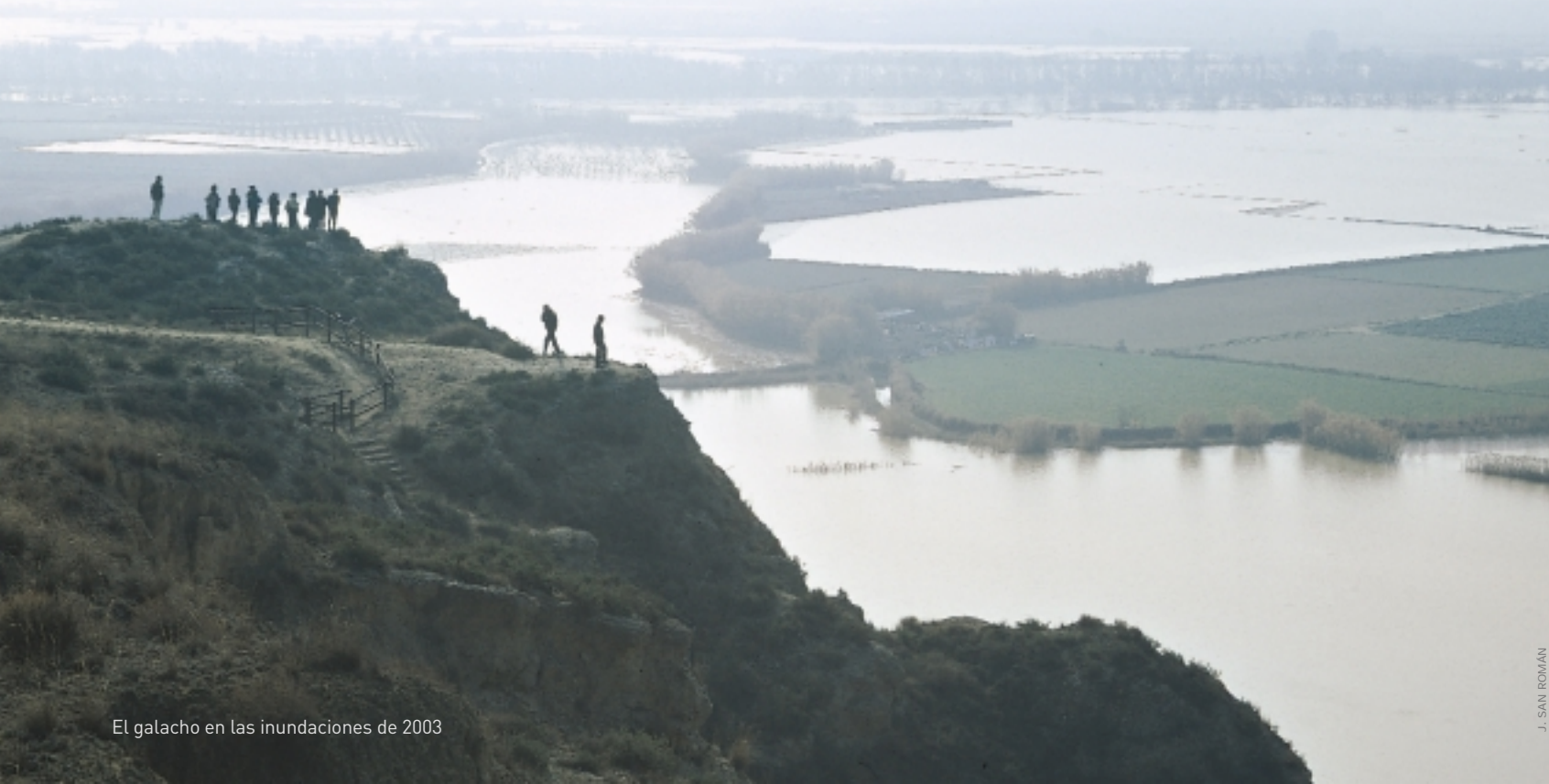
El galacho en las inundaciones de 2003