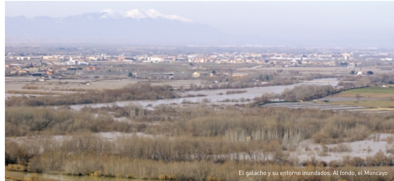
El galacho y su entorno inundados. Al fondo, el Moncayo