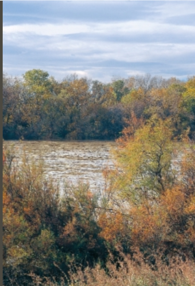
J. SAN ROMÁN

(derecha, arriba) El río Ebro cerca del galacho de Juslibol (derecha, abajo) Plaza del Arzobispo (página siguiente) Escarpe y acequia del galacho en las últimas nevadas