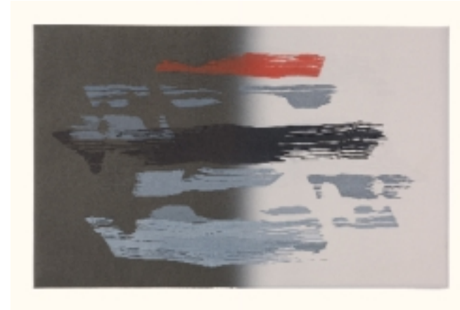
▲ GRABADO DE JOSÉ M. BROTO