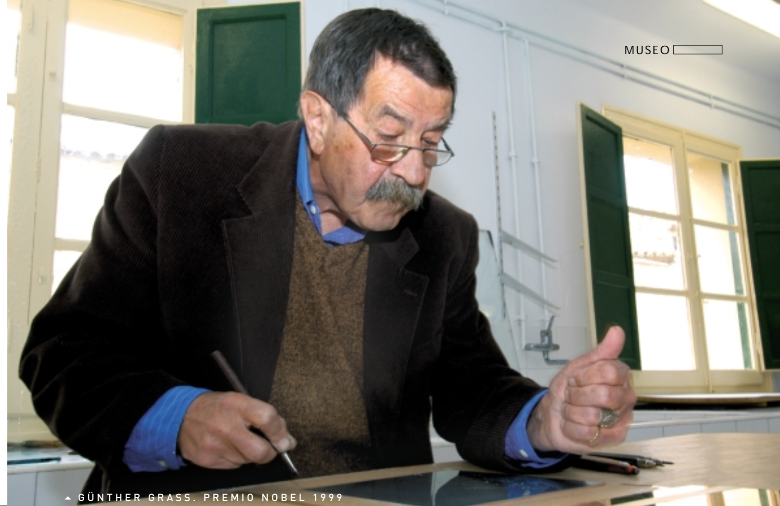
▲ GÜNTHER GRASS. PREMIO NOBEL 1999