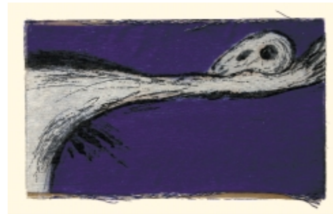
▲ GRABADO DE VÍCTOR MIRA

Un trabajo que ha ido fructificando de tal manera, fundamentalmente debido a la oferta y demanda que se han ido generando, que al día de hoy el pueblo natal de Goya ya está trabajando en un nuevo reto cultural: la creación de un Centro de Arte Gráfico Contemporáneo (con un apartado especial para el –históricamente reclamado– Centro de Interpretación de Goya), con la esperanza de que si al día de hoy Fuentetodos constituye un singular atractivo cultural y turístico cara al visitante (los más de 300.000 visitantes en la última década así vienen a ratificarlo), este nuevo proyecto pueda seguir consolidando a este pequeño municipio zaragozano en uno de los lugares más singulares de la cultura aragonesa. ■