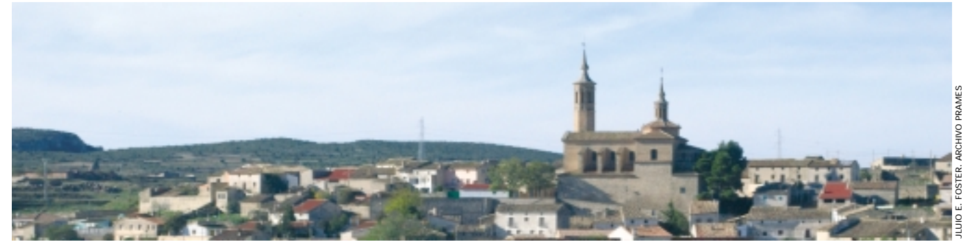
JULIO E. FOSTER. ARCHIVO FRAMES

TEXTO: B. Oca • FOTOS: Archivo Consorcio Goya-Fuendetodos