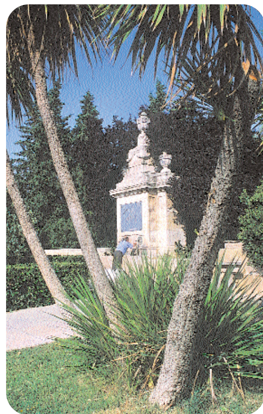
Fuente de los Incrédulos, neoclásica en piedra blanca, ofrecida a la ciudad por Ramón de Pignatelli

Muchos años ha necesitado Zaragoza para llegar al número de fuentes y láminas de agua que en este reportaje se enumeran. Hasta 1786 no tenemos noticia de fuente alguna. En esa fecha D. José de Pignatelli inaugura la fuente de los Incrédulos, recordatorio de la llegada del agua por el Canal Imperial de Aragón, considerada en su época como la obra hidráulica más importante de Europa.