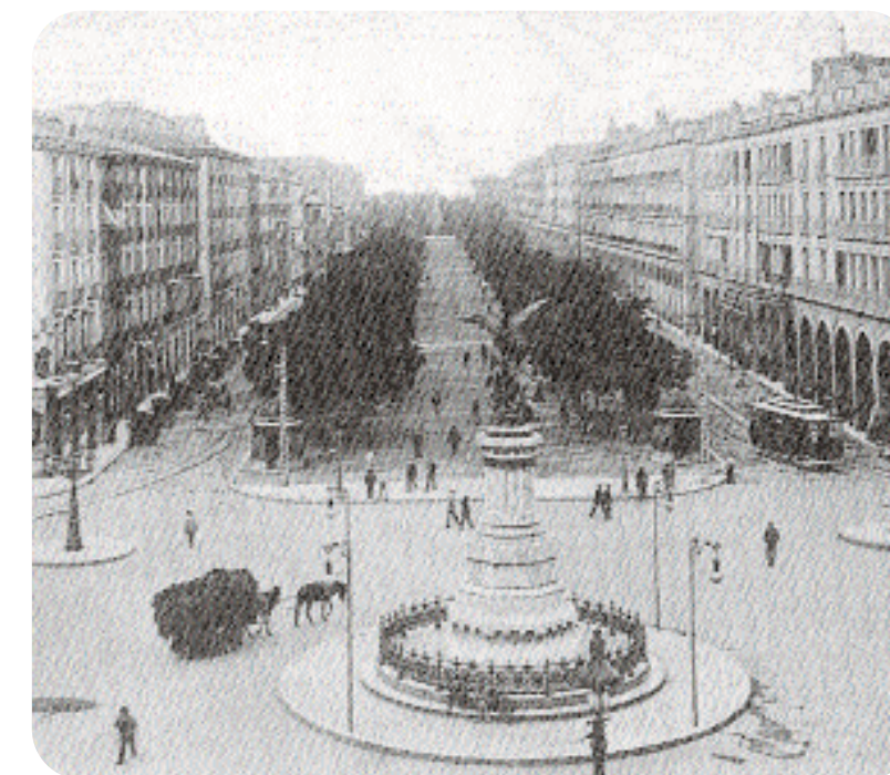
Monumento y fuente de la plaza de España. Década de 1920

Para proteger el conjunto central de la plaza de los Sitios, se creó un anillo circular con movimiento de agua. Tanto la remodelación de la plaza como la fuente fueron obra del arquitecto Manuel Fernández Valenzuela y las obras concluyeron en 1998.