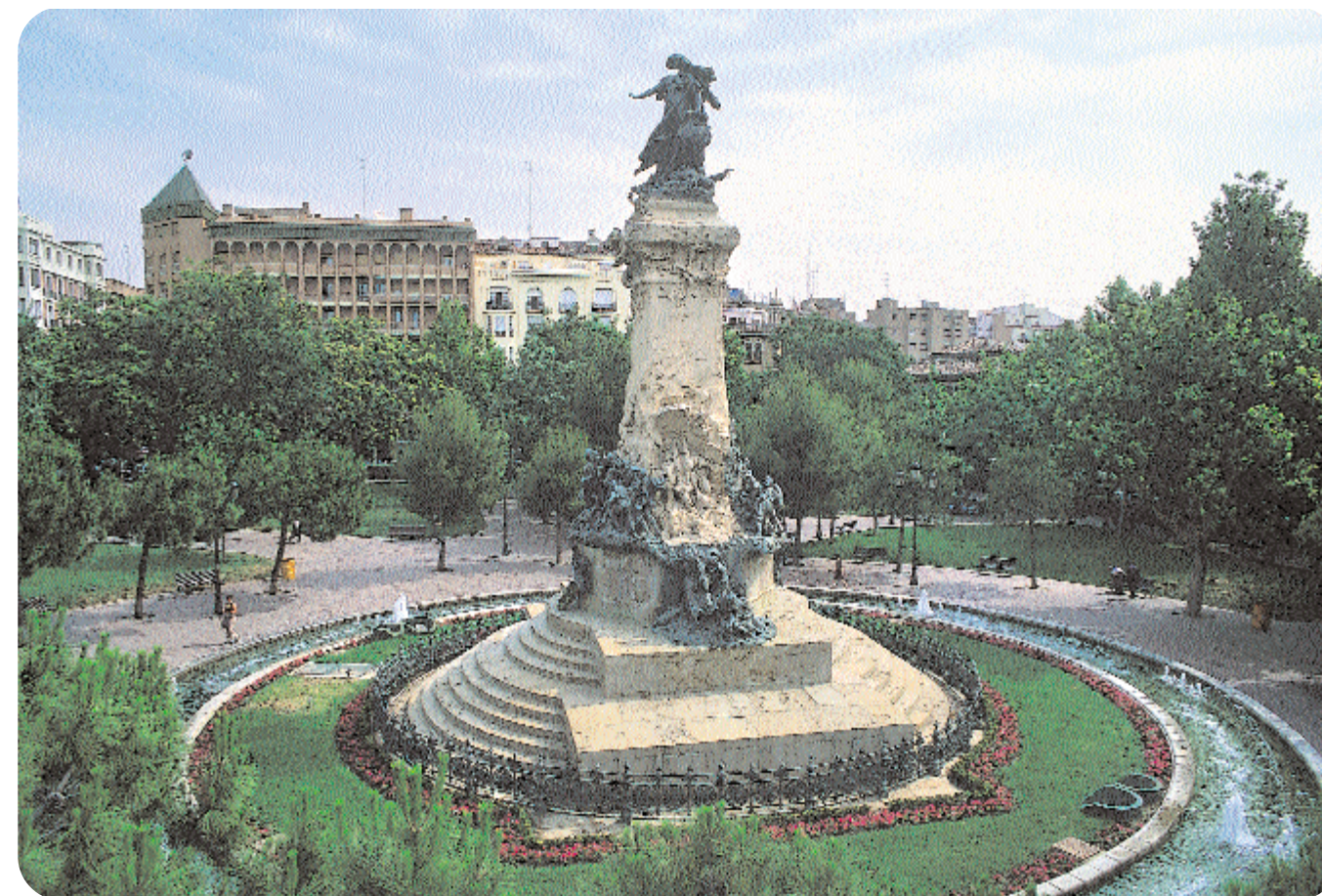
Vista panorámica de la fuente y del monumento, inaugurado con motivo del primer centenario de los Sitios de Zaragoza. Última remodelación en 1998