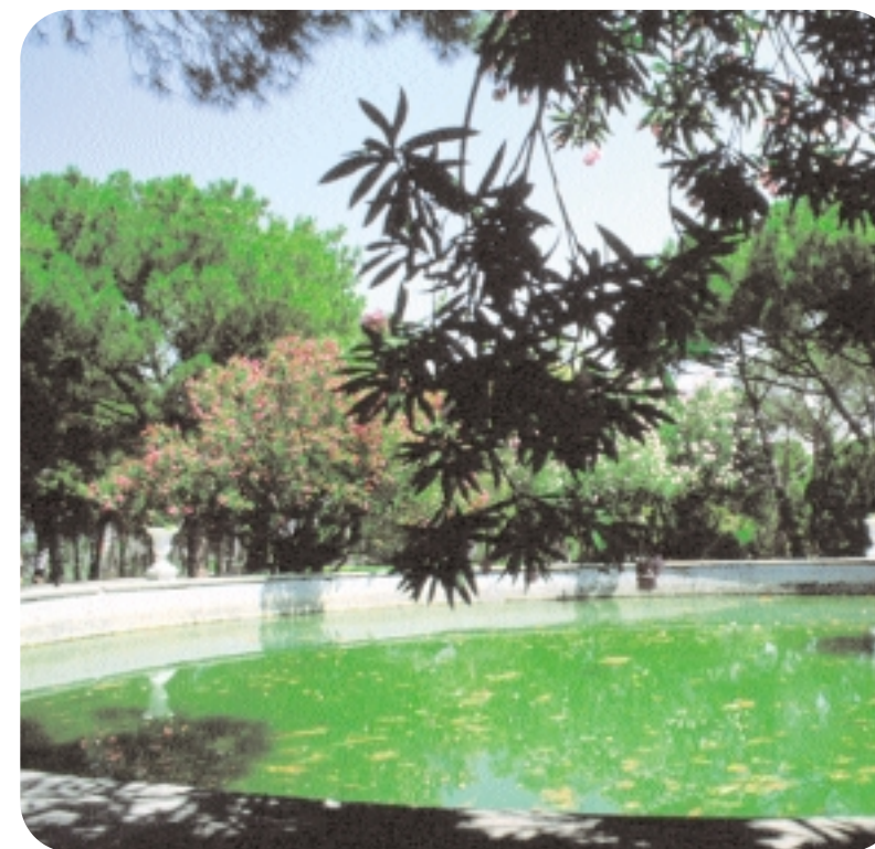
Estanque del depósito del Mirador. Parque Primo de Rivera