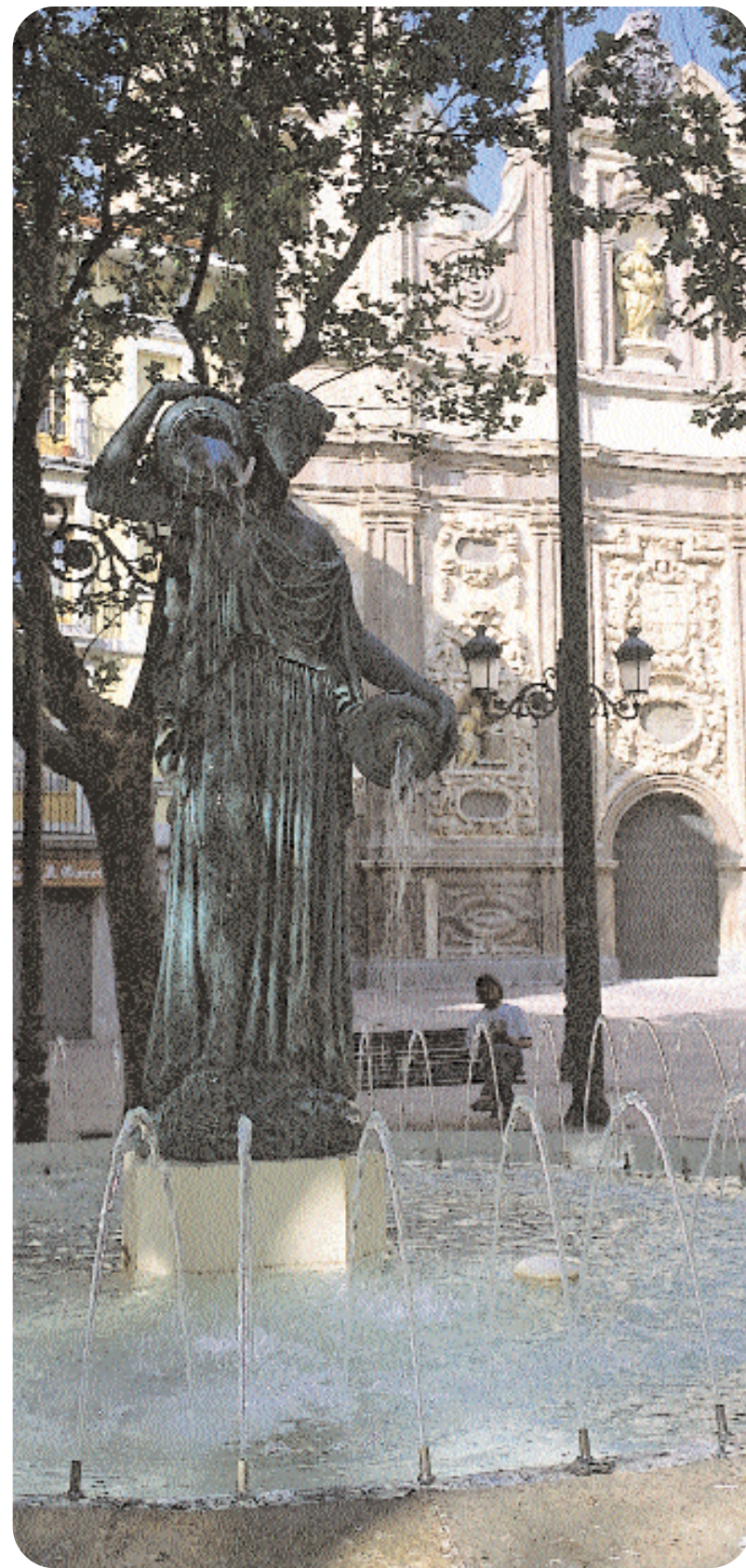
Esta ninfa griega, conocida popularmente como La Samaritana , estaba situada inicialmente en la plaza de La Seo, actualmente en la que muchos zaragozanos siguen conociendo como plaza de San Cayetano

Pasado algún tiempo, tenemos constancia de la construcción de la fuente de La Samaritana, procedente de los talleres de fundición Averly. De autor desconocido, su instalación data de 1862. Ha pasado por distintas plazas hasta encontrarla definitivamente en la plaza del Justicia.