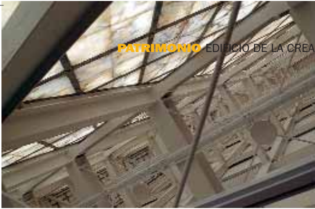
PATRIMONIO EDIFICIO DE LA CREA