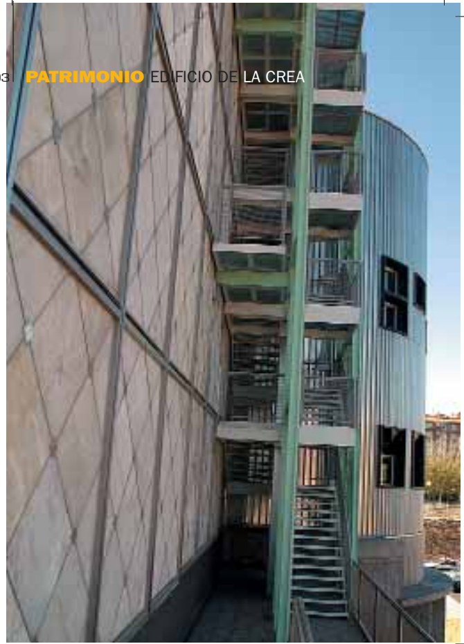
Escalera de emergencia.

También se ha suprimido una de las dos paredes de alabastro, lo que ha permitido recuperar muchas placas, y en muy buen estado, para colocarlas en el exterior y prescindir de las más deterioradas. Y es que los cerca de ocho años que el pabellón estuvo a merced del sol, la lluvia y el viento, han sido una dura prueba para este material, sobre todo si tenemos en cuenta que el alabastro no fue tratado ante la perspectiva de un regreso inmediato a Zaragoza, una vez concluida la Ex-