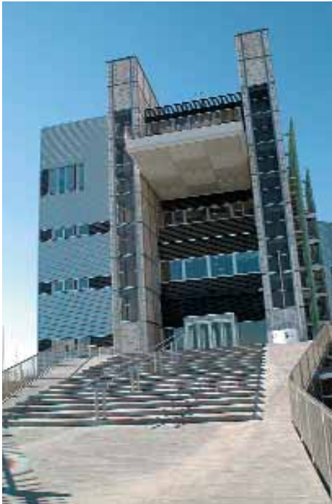
Estructura interior del edificio de la CREA. Alrededores del edificio en mal estado. Puerta posterior. A la derecha, bocetos del edificio, del arquitecto José Manuel Pérez Latorre.

Por dentro, ya no es tanto un edificio para ver como para trabajar, aunque con algún matiz. Sus nuevos dueños, los empresarios aragoneses, esperan que sea también un espacio abierto a la sociedad, donde poder albergar actividades y exposiciones que contribuyan al dinamismo económico, social y cultural del conjunto de Aragón. Pero mientras este deseo se hace realidad, lo cierto es que sin llegar a cruzar sus puertas merece la pena conocerlo. Tiene un fuerte carácter y aunque tal vez no vaya a ser un símbolo importante para la ciudad, por su condición de