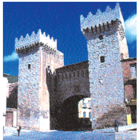
Puerta Baja. Daroca

Queda claro que toda la comarca es un regalo para los sentidos, pero de la ciudad de Daroca cabe destacar la Basilica de Santa María , la iglesia de San Juan , la iglesia de San Miguel , todas de origen románico . El mudéjar también es característico del lugar. Puede visitar la Torre de Santo Domingo de Daroca, detenerse en el ábside de la iglesia de San Juan de la Cuesta o la