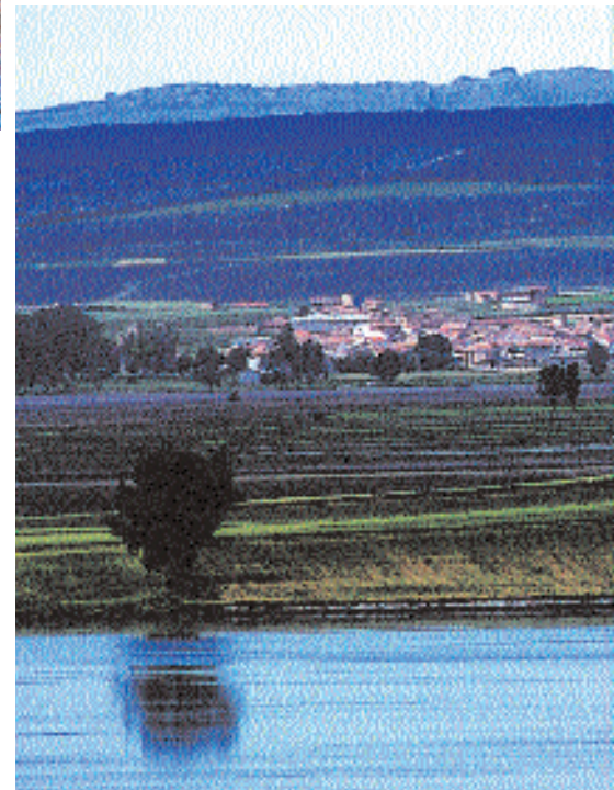
La Laguna de Gallocanta con toda su belleza

y otros antiguos ornamentos por la ciudad. Otras festividades que se celebran en la mayoría de las localidades de la Comarca son las dedicadas a los santos Miguel, Martín y Blas, donde se encienden hogueras como símbolo de pureza.