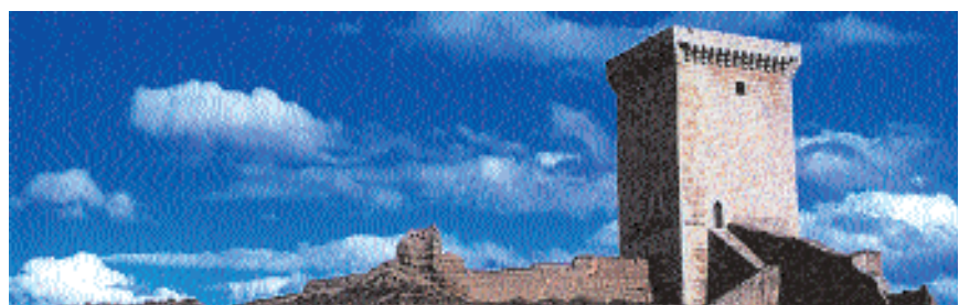
La Torre de la Espuela. Daroca

La comarca de Daroca es, por lo tanto, un tesoro para nuestros sentidos.