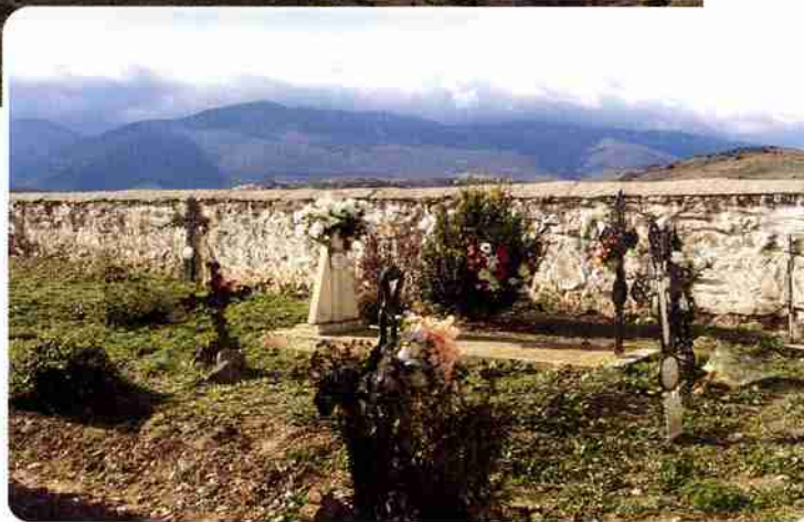
Derecha: Cementerio de Alcalá. Debajo: los restos del castillo de Talamantes.

su totalidad con el fondo del Moncayo, una montaña siempre majestuosa, da igual que se vista con el verde del verano, con los tonos rojizos y amarillentos del otoño, con la nieve blanca del invierno o incluso en los días como hoy en que una nube inmensa se queda varada en él, cubriéndole como un manto de algodón, cosa que sucede con bastante frecuencia.