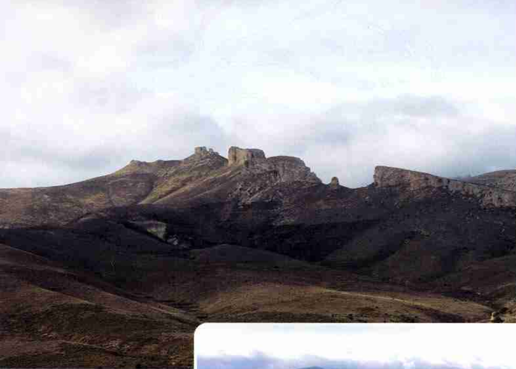
Arriba, las Peñas de Herrera.