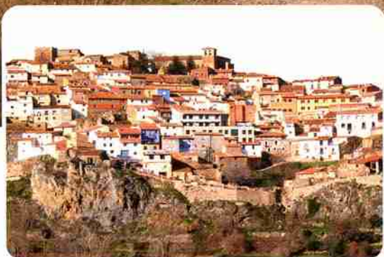
Un grupo de jinetes cabalga en las cercanías de las Peñas de Herrera. Debajo, el caserío apiñado de Añón.