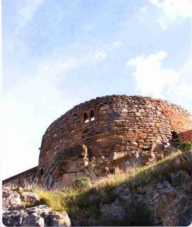
Izquierda: restos del castillo de Añón.