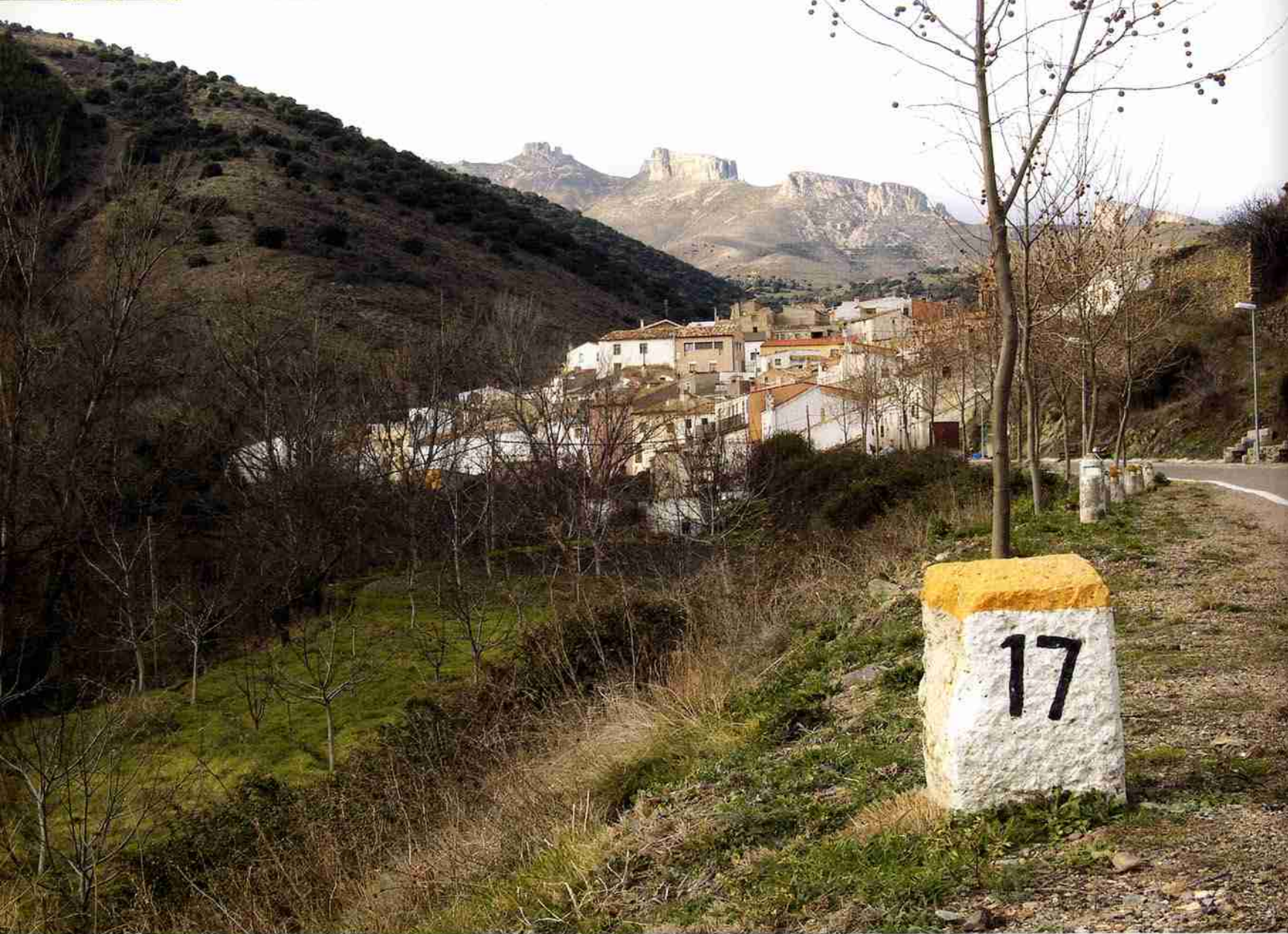
La localidad de Talamantes con el telón de fondo de las Peñas de Herrera.

El casco urbano se asienta sobre una ladera bajo el castillo, con calles estrechas y empinadas, y enfrente discurre el arroyo de Valdeherrera, se abren hueco las huertas y un poco más arriba se asienta la ermita del patrón de la localidad, San Miguel. Como telón de fondo, la estampa más majestuosa de las Peñas de Herrera. Talamantes es un lugar perfecto para el descanso, pero también para los amantes del senderismo que desde aquí pueden partir de excursión hacia la cara oculta del Moncayo (la zona de Calcena y Purujosa) o cualquiera de los parajes naturales que rodean el pueblo. En menos de dos horas de caminata se pueden alcanzar puntos como el barranco de Valdeplata, el collado del Campo, la propia cumbre de las Peñas de Herrera o cualquier otro punto que uno quiera elegir sobre el mapa de una zona en la que cualquier paseo discurre por lugares de un gran interés.