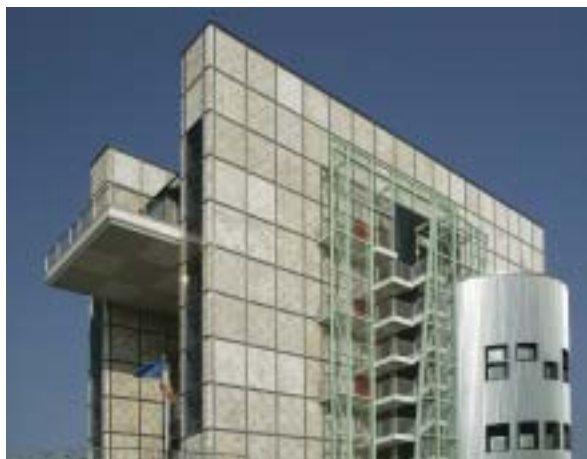
El que fuera Pabellón de Aragón en la Exposición Universal de Sevilla en 1992 regresó años después a Zaragoza de la mano de la Confederación de Empresarios (CREA). Ahora se ha convertido en un emblema a la orilla del Ebro.

Tras seis años de abandono en la capital andaluza, el edificio iba a ser derribado por la sociedad La Cartuja para ceder terreno al parque temático Isla Mágica. Por suerte,