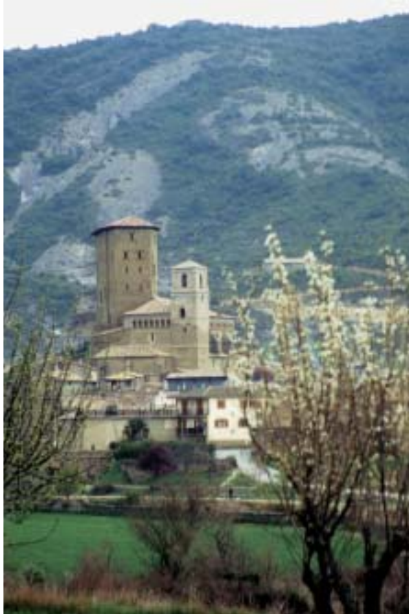
Vista de Biel, con su torre de planta octogonal.

El románico, por lo tanto, alcanzó un esplendor inusitado en esta comarca. Pero, la profusión de obras de este periodo no debe ocultar los magníficos ejemplos artísticos que dejaron otros pueblos. La huella romana se deja notar de manera significativa en Sádaba. Restos de un foro, un acueducto, termas, construcciones militares y el poblado de los Bañales y el mausoleo de la familia Atilia conforman la carta de presentación del paso de los romanos por esta villa. El gótico también dejó su legado en Sádaba. La esbelta iglesia de Santa María, dentro del núcleo urbano, obliga al visitante a estirar el cuello y echar la cabeza hacia atrás para observar por completo este erguido templo.