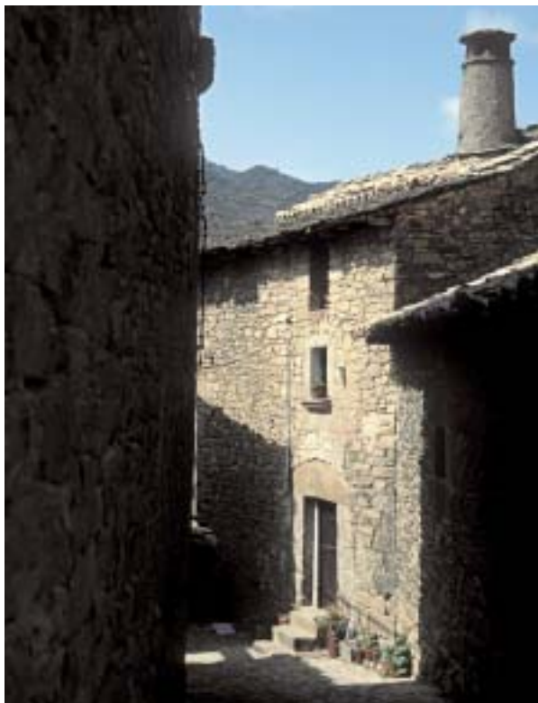
La arquitectura típicamente pirenaica puede verse también en Longás, en la comarca de las Cinco Villas.