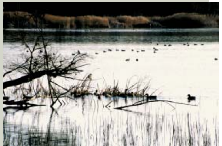
Lagunazo de Moncayuelo, en Ejea

museístico al aire libre, natural, sin cortapisas, un centro de interpretación de la historia, el arte y la naturaleza de una parte desconocida de Aragón, pero que ha participado activamente en el devenir de lo que es hoy en día el territorio aragonés.