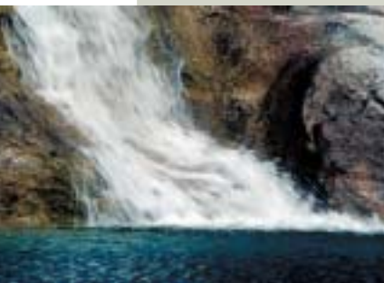
Pozo Pigalo, en Luesia.

La zona alta de las Cinco Villas y las localidades limítrofes de la provincia de Huesca integran el Territorio Museo, una iniciativa respaldada con fondos europeos con la que se pretende dinamizar el tejido social de la zona. La sangrante emigración sufrida por estos pueblos del Prepirineo dejó a esta parte de la comarca abatida. Pero ahora, en pleno siglo XXI, las altas Cinco Villas quieren sacudirse de encima esa apatía que había impregnado a sus gentes para salir adelante devolviendo el esplendor perdido a sus grandes recursos, los artísticos y los naturales. En esta tierra en la que el arte y la historia asalta al visitante en cualquier esquina y en la que la naturaleza se muestra en un estado de autenticidad difícil de encontrar, sus gentes se agarran a la denominación de Territorio Museo para difundir sus encantos y conseguir, así, asentar a la escasa población. Esta zona, por lo tanto, quiere decir a los cuatro vientos que es un espacio