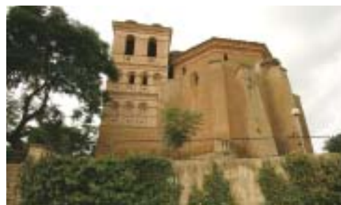
Iglesia de Polesino.

Los animales de caza menor se consumen con asiduidad: dos de los platos más sabrosos del lugar son la liebre a la abadesa y el conejo enterrado de Monegros, este último de costosa elaboración, ya que supone enterrar al conejo bajo tierra, bien protegido, sobre el que se prende fuego durante varias horas para que se haga poco a poco □