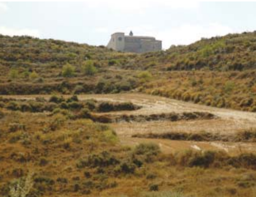
Santuario de la Virgen de Magallón en Leciñena.

La ermita de San Caprasio, próxima al punto más alto de la sierra de Alcubierre, muestra su austeridad sobre una espléndida panorámica de la zona central del valle del Ebro.