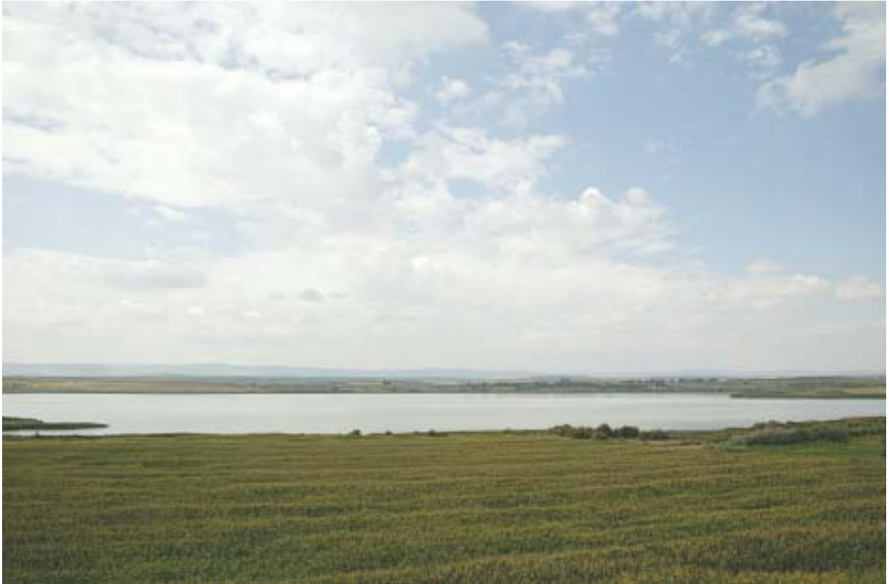
La Laguna de Sariñena es el humedal más grande de Aragón tras Gallocanta.

za, a 11 kilómetros de Sariñena, bebe del Flumen. Disfrutaremos de su principal monumento, la iglesia, y del sabor de sus casas solariegas, con escudos heráldicos y atractivos portales. Un poco más arriba, el que fue según la tradición el lecho de muerte de Alfonso I el Batallador, Poleñino, donde encontraremos la casa palaciega de la Una, gran edificación perteneciente a un vizconde con un impresionante patio cercado por una robusta reja de hierro.