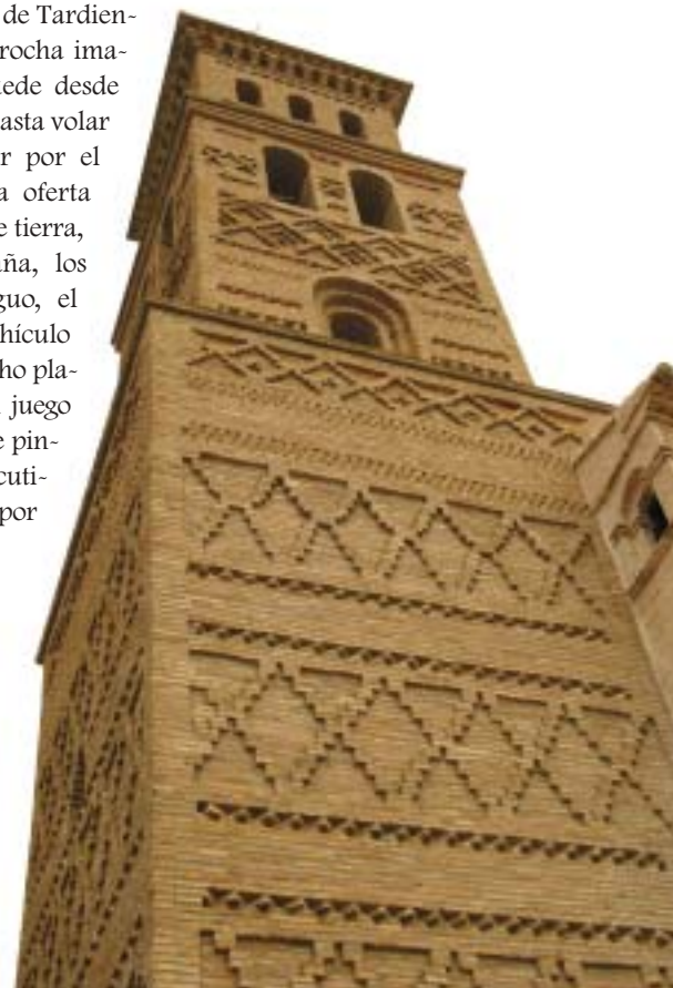
Torre mudéjar de Alcubierre.

industrias. Acoge el "abrazo de Tardienta", el punto de unión de una red de canales de las aguas del Gállego y del Cinca. Pero el nombre de esta villa se oye más en estos días por otros motivos: se ha convertido en una oferta turística diferente y original, con el Centro de Deportes de Aventura de Tardienta, un complejo que derrocha imaginación y donde se puede desde montar en dromedario, hasta volar en ultraligero o navegar por el canal. Complementan la oferta de actividades el velero de tierra, las bicicletas de montaña, los paseos en sidecar antiguo, el pájaro UyUyUy (un vehículo propulsado a hélice de ocho plazas) o el "paint-ball" (un juego de batallas con pistolas de pintura y al que algunos ejecutivos ya se han apuntado por sus virtudes anti-stress).