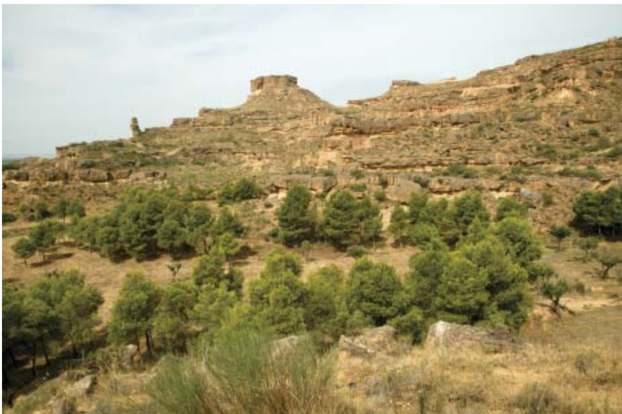
En la foto, los torrallones de la zona de Alberuela de Tubo.