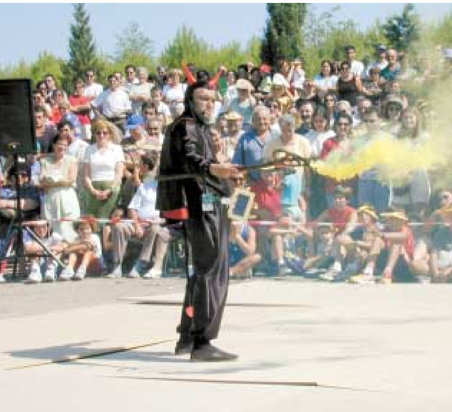
Arriba, el diablo del dance de Cabañas de La Almunia.