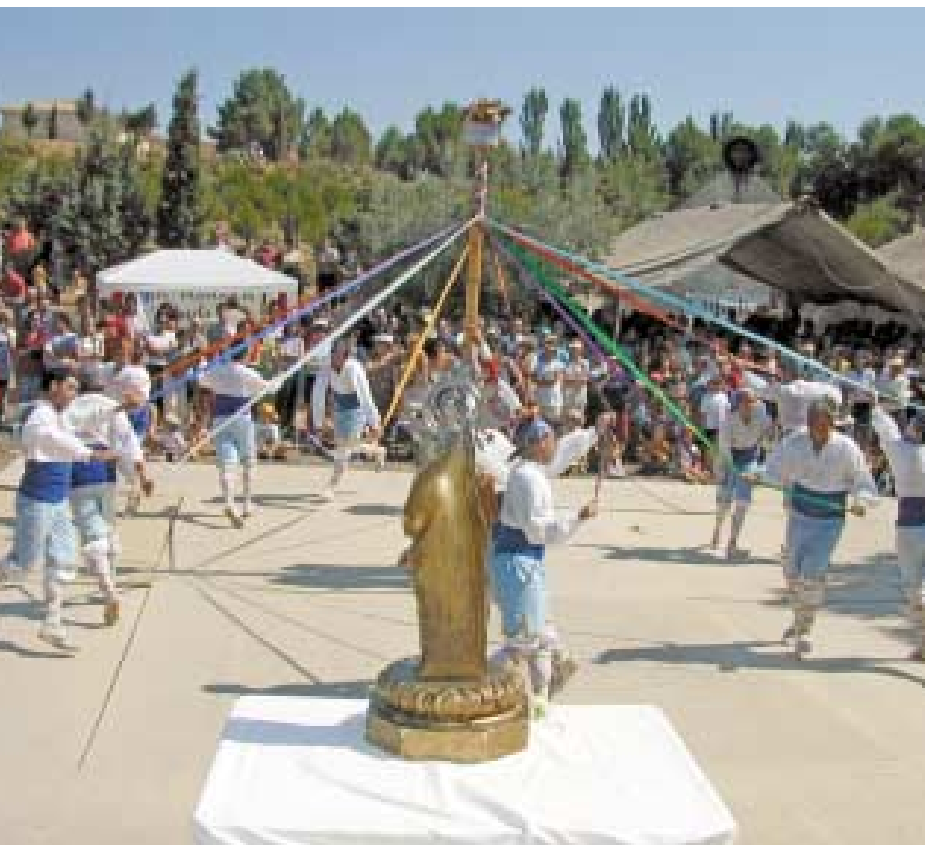
Debajo, el baile de cintas.

fanas sirvan para celebrar el prodigio de la aparición de la Virgen de Magallón, huida de este pueblo por el sacrilegio de un delito de sangre cometido en la iglesia, para aparecer en las trochas de los Monegros al pastorcillo Marcén y provocar que las gentes bailen como podrían rezar.