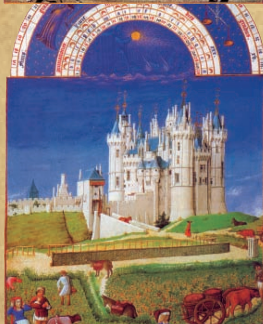
Las muy ricas horas del Duque de Berry. Roger Violet.