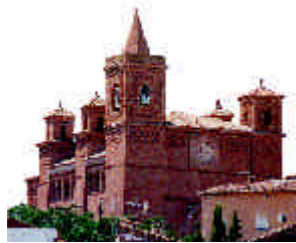
San Félix. Torralba de Ribotla

Las Iglesias-fortaleza , tipología surgida en el s.XIV en los territorios de frontera, constan de nave única con capillas laterales, cabecera recta y tribuna que rodea al