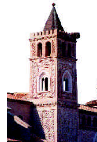
Iglesia de la Asunción. Quinto

Discurre jalonado por algunos de los ejemplos más interesantes del mudéjar aragonés, edificados entre los ss. XIII y XVI. La ciudad de Zaragoza fue centro de creación y difusión del mudéjar, contando con el palacio de la Aljafería, la Seo, las parroquias de San Pablo, San Gil, la Magdalena, San Miguel de los Navarros y el convento del Santo Sepulcro. Desde la majestuosa torre octogonal de Santa María de Tauste , hasta la elegante factura del campanario octogonal del Monasterio de Nª Sª de Rueda, encontramos ejemplos como San Pedro de Alagón , relacionada con Tauste; la magnífica torre de Utebo , con un interesante trabajo ornamental sobre estructura mixta tardía, establecida a finales del s. XV por la cercana torre de San Miguel de Alfajarín ; o la "iglesia vieja" de Quinto , realizada por estilizados vanos y la fina decoración de lazo de su torre.