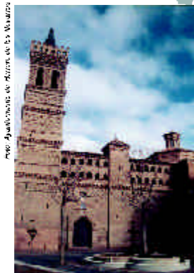
San Juan Bautista. Herrera de los Navarros

Especial interés revisten las iglesias-fortaleza de Herrera de los Navarros y Azuara , construidas en el s. XIV y con ampliaciones barrocas. Entre las torres más notables, hay que señalar la de la parroquial de Villar de los Navarros , de estructura cristiana y con torre secundaria para alojar la escalera; la secundaria se decora con zig-zag y esquinillas y la principal con rombos, arcos mixtilíneos y lazos de cuatro octogonal. Especial mención merece Belchite que conserva entre sus ruinas los restos de la iglesia de San Martín y de la torre de San Juan, así como muestras de la pervivencia de la tradición constructiva mudéjar en la arquitectura civil; el santuario de Nª Sª del Pueyo cuenta con torre mudéjar del s. XVI. Otros monumentos mudéjares de especial interés son las iglesias de Mainar , Encinacorba y Paniza , y las torres de Longares , Villarreal de Huerva , Aguilón , Villanueva de Huerva , Moyuela y Mediana de Aragón .