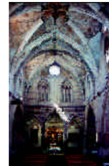
Iglesia parroquial de la Virgen. Tobed

Concentran bellos ejemplos del mudéjar aragonés, contando con varias iglesias-fortaleza que han conservado en gran medida la concepción espacial mudéjar; es el caso de Santa María de Tobed , San Félix de Torralba de Ribota , Santa María y Santas Justa y Rufina de Maluenda , y Santa Tecla de Cervera de la Cañada . Son notables las techumbres de madera de la capilla del Castillo de Mesones de Isuela , las de los salones de los palacios de los Luna en Illueca y Daroca , así como los alfarjes de la ermita de Cabañas de La Almunia de Doña Godina , Torralba de Ribota o Tobed . Los exteriores se decoran con labores de ladrillo y cerámica, siendo de especial riqueza las fachadas de Tobed y San Martín de Morata de Jiloca y las torres de la Asunción de La Almunia de Doña Godina y Ricla , Santa María de Ateca , o San Pedro de Romanos .