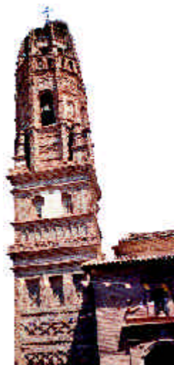
Santa María. Utebo

Las torres-campanario son la manifestación más genuina del mudéjar aragonés; junto a las de estructura cristiana, divididas interiormente en estancias, se desarrolla desde finales del s. XIII la de alminar, con torre interior o machón central envuelto por una torre externa, con escalera entre ambas. Formalmente presentan planta cuadrada, octogonal y mixta, decoradas con variados motivos de ladrillo resaltado y cerámica.