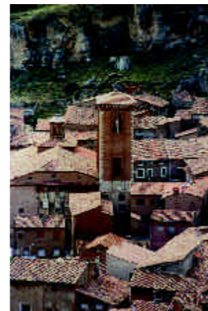
Santo Domingo. Daroca

Calatayud y Daroca , dos de las ciudades mudéjares de mayor importancia en Aragón, conservan la impronta de un urbanismo de raíz islámica y una notable concentración de monumentos mudéjares.