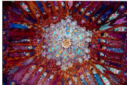
Castillo de Mesones de Isuela

En la decoración perviven los principios compositivos y los motivos formales del arte islámico, asimilando motivos del arte cristiano. Los exteriores se decoran con motivos geométricos en ladrillo resaltado y aplicaciones cerámicas, cubriendo las superficies murales; los interiores se revisten con pinturas y agramilado, celosías de yeso y techumbres de madera, combinando motivos geométricos, vegetales y figurados, creando espacios diáfanos e intimistas, de gran riqueza cromática. La decoración epigráfica es escasa en el mudéjar aragonés.