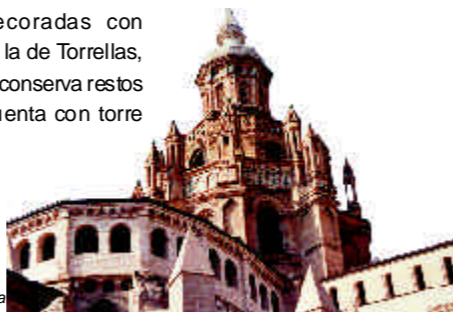
Catedral de Tarazona