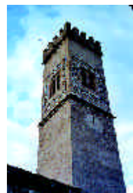
Nª Sª de los Angeles. Longares

Los ríos Huerva y Aguas Vivas enmarcan un territorio en el que el mudéjar dejó su huella, desde los primeros pasos apreciables en los restos de la ermita cisterciense del Santo en Tosos , del siglo XIII, hasta los tardíos ejemplares de torre mudéjar de Luesma , Moneva , Mezalocha y Mozota .