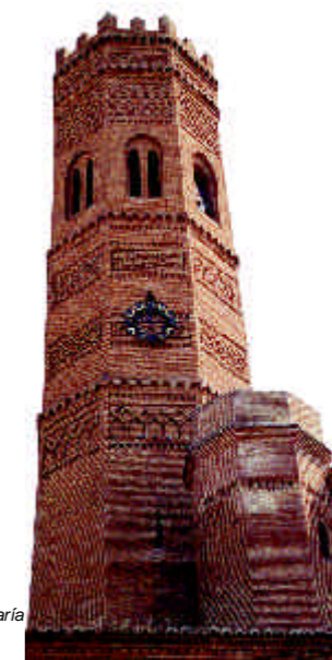
Santa María Tauste

Al norte del Ebro, en una doble vía marcada por el curso del Gállego y el camino que se dirige hacia la Sierra de Alcubierre, se suceden edificios de interesante y original fábrica mudéjar, conservando esbeltas torres como las de Nª Sª del Coro de Peñafior , San Mateo de Gállego , Leciñena y Villamayor , destacando ésta última por su elaborado trabajo ornamental de ladrillo y cerámica. Junto a estas torres podemos encontrar también algunas interesantes fachadas como las de San Mateo de Gállego y Peñafior .