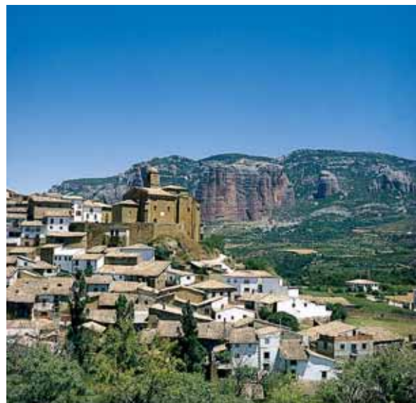
Vue des Mallos

Finalement, le touriste peut visiter la dernière étape du Chemin Français de Santiago en Aragón dans la région de la Jacetania avec ses impressionnants ensembles comme ceux de Salvatierra de Escá, Mianos, Artieda ou Sigües.