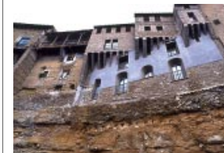
"Casas voladas", Tarazona.

En un antiguo palacio renacentista con cuidada decoración que combina mobiliario moderno y antiguo. Precio: de 60 a 148 €. www.condesdevisconti.com