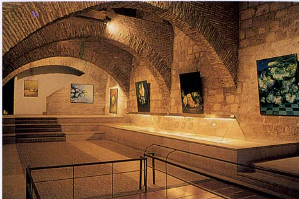
Bajos del Palacio Episcopal