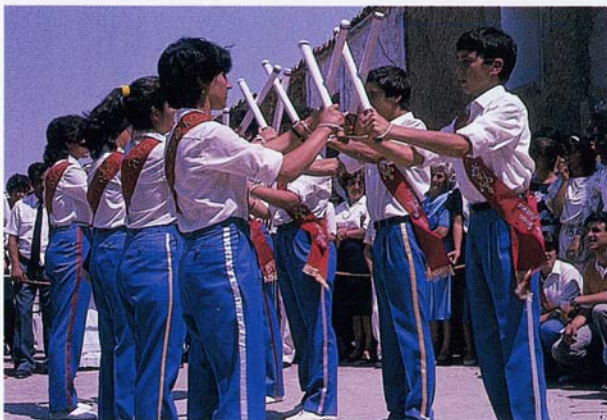
Dance o Paloteao

Su fin preferente es la publicación y distribución de la revista TVRIASO , que en 1992 alcanzó su número X. También ha publicado otros trabajos monográficos referidos a la comarca de Tarazona, las actas de