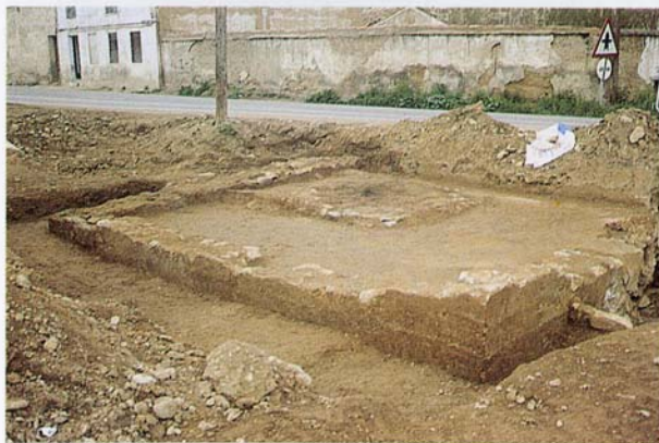
Excavaciones en Pradiel.

Este aspecto, que fue origen y núcleo generador de la nueva etapa del C.E.T., ha dado resultados destacables. Como ejemplos se pueden citar algunos: el descubrimiento de doscientos yacimientos o elementos arqueológicos en toda la comarca -entre ellos, la cabeza romana de sardónice custodiada en el Museo Provincial de Zaragoza; el alfar de lucernas romanas de la calle Caracol en Tarazona, el primero documentado en el valle del Ebro; el inventario de los materiales arqueológicos de la colección que la Compañía de Jesús reunió en el Monasterio de Veruela; el depósito de cerámicas del S. XVIII recuperado del Hogar Doz; varias campañas de arqueología urbana en Tarazona; el estudio de numerosos edificios, algunos tan importantes como las mezquitas mudéjares de Torrellas y Tórtoles, la