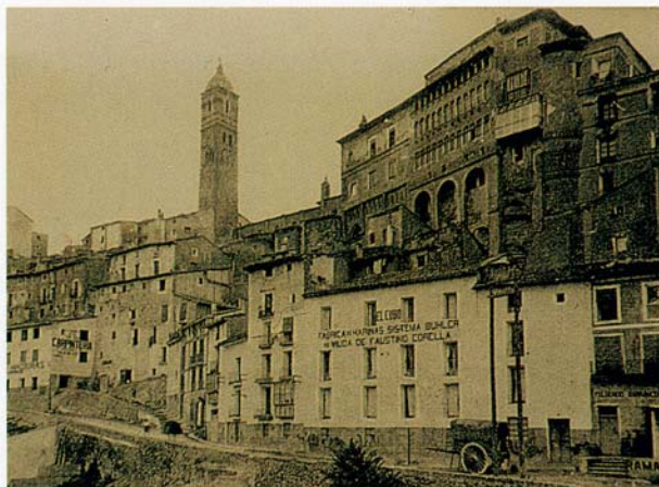
Tarazona. Fotografía antigua

El Parque Cultural del Moncayo que implica aspectos de desarrollo económico y social- es el segundo de estos objetivos.