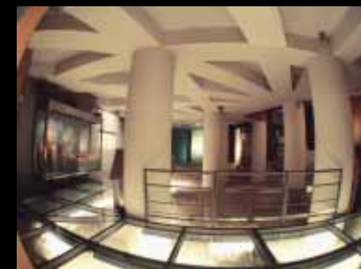
(izquierda y abajo) Los restos que albergan el Museo del Puerto Fluvial corresponden a los edificios anejos al foro, a la orilla derecha del Ebro

Pero todas las obras humanas tienen principio y final. Transcurridos casi cuatro siglos de su diseño y ejecución, el foro que ahora vemos descarnado, con sus paramentos de opus caementicium , comenzaba a experimentar los achaques del paso del tiempo y de un mantenimiento deficiente. La atmósfera que destilan los restos de las cloacas que podemos contemplar y que desaguaban en el río Ebro, a finales del siglo IV estaban cegadas o fuera de servicio. Al no recoger las aguas pluviales no es difícil imaginar encharcada la plaza descubierta del foro con las consiguientes molestias para los ciudadanos. Estas imponentes ruinas dan fe de la grandiosidad de Zaragoza en época romana, pero también confirman el tránsito a nuevas culturas que van a ir conformando poco a poco el espacio urbano de siglos venideros.