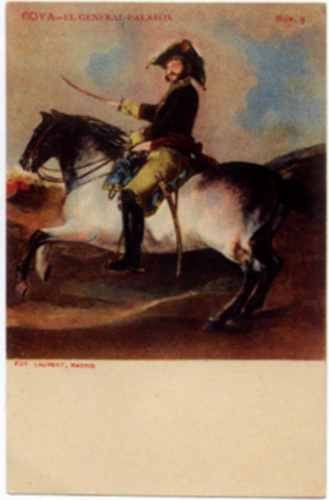
General Palafox, por Goya. Tarjeta postal editada por Laurent, 1903.