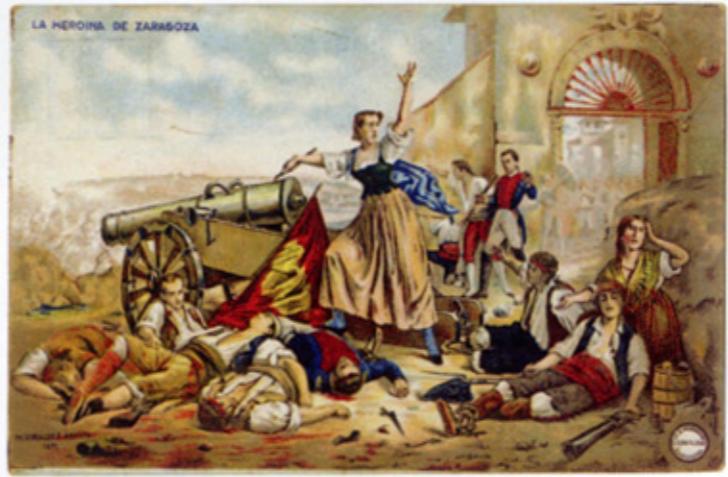
La Heroína de Zaragoza. Cuadro de Hiráldez Acosta. Editorial Madriguera, 1908.