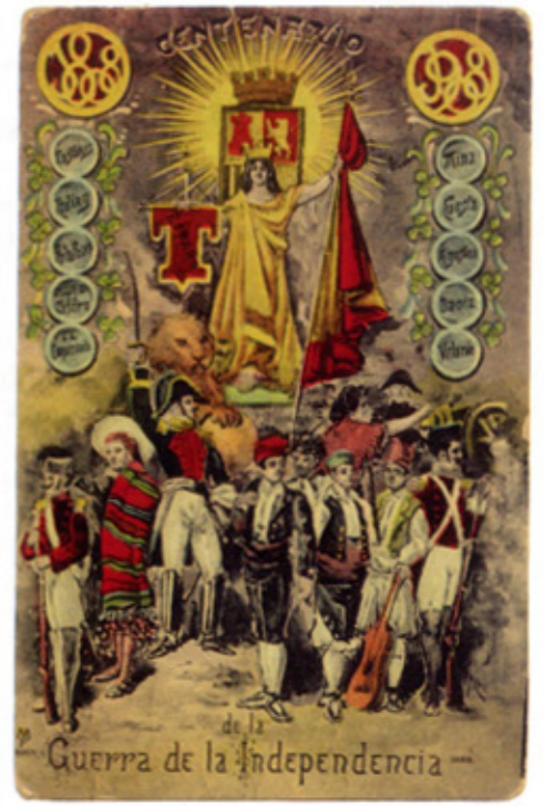
Centenario de la Guerra de la Independencia. Tarjeta postal ilustrada por Montes, editada por MP, de Madrid, núm. 1686, 1907.