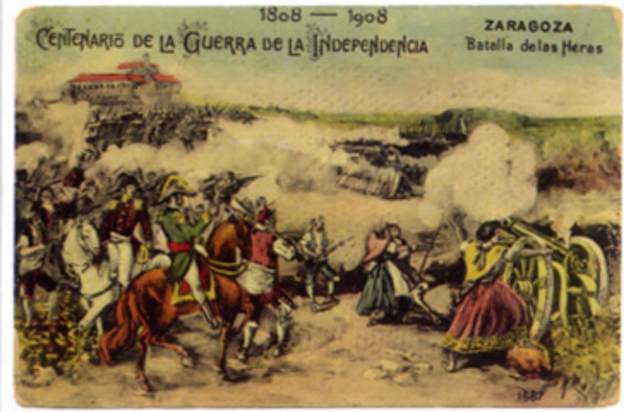
Centenario de la Guerra de la Independencia. Tarjeta postal ilustrada por Montes, editada por MP, de Madrid, núm. 1687, 1907.