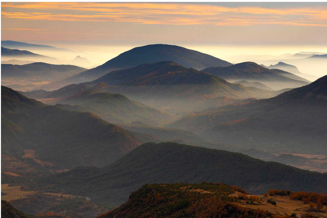
31T 272245 E / 4704178 N. La Fueva desde la senda de la espelunga de San Victorián