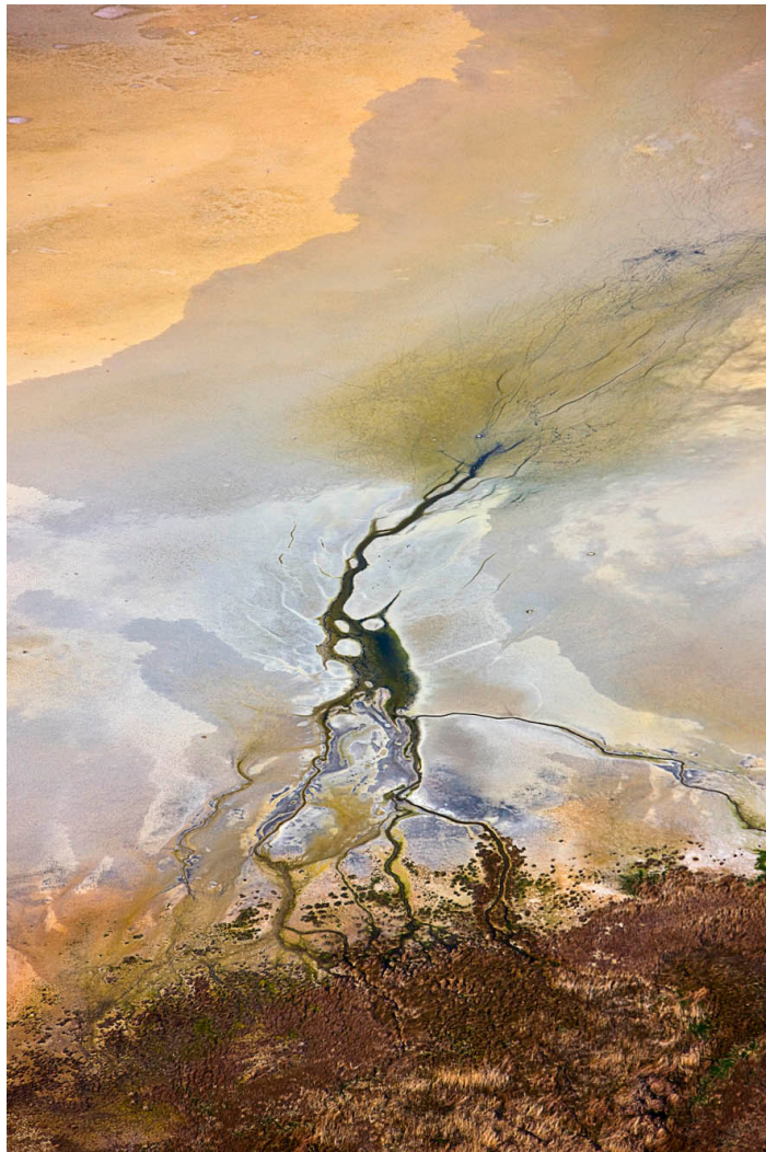
30T 624460 E / 4536400 N. Laguna de Gallocanta